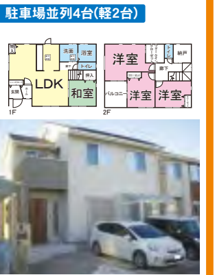
スマト住宅(太陽光3.15kw、EV充電)築約3年