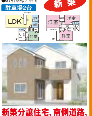
新築分譲住宅、南側道路、 海蔵小学校区、建築中