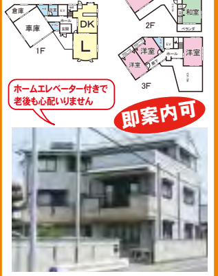
鉄骨造3階建、前面道路東側12m