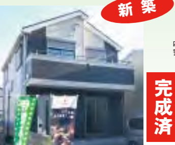
シャッター雨戸付、 南側道路約5.3m、 イオンモール四日市北店・川越富洲原駅徒歩圏内