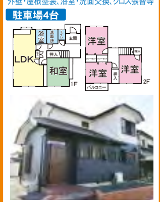
駐車場4台、充実のリフォーム内容