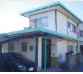
海蔵小学校・山手中学校・駅・スーパー・病院徒歩圏内